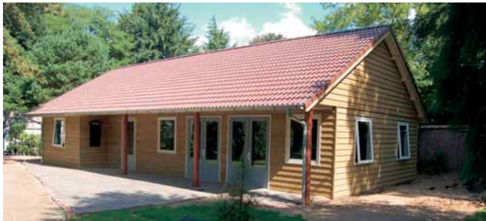
Het nieuwe bezoekerscentrum

Het bezoekerscentrum is nog voor de zomer gebouwd. Door het gekozen bouwsysteem kon dit binnen twee weken gedaan worden, nadat de aannemer eerst het fundament had gelegd. Na de zomer is het afbouw- en installatiewerk gedaan en in het najaar de verdere inrichting, waaronder de keuken.