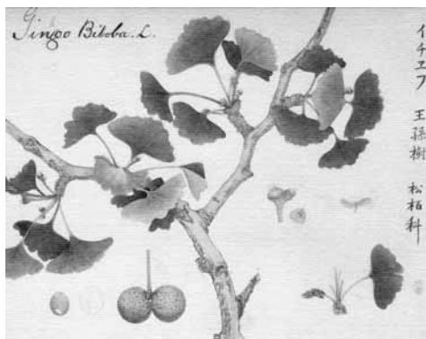
Ginkgo biloba door Chikusai Kato (1881)

Ginkgo biloba is de enige overlever uit een familie die eens voorkwam in het gehele noordelijke halfrond. De familiegeschiedenis gaat 280 miljoen jaar terug. Fossielen van het geslacht Ginkgo zijn reeds bekend uit de Jura-periode (190 miljoen jaar geleden). Ongeveer zeven miljoen jaar geleden stierf de soort uit in Noord-Amerika, drie miljoen jaar terug in Europa.